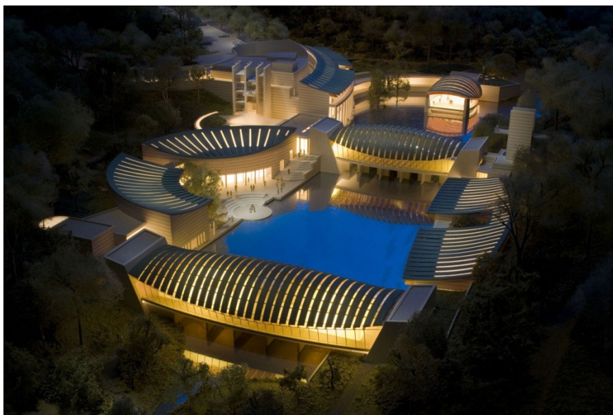
Crystal Bridges Museum of American Art

Un alt beneficiu al participării galeriilor și al tuturor celorlalți stakeholderi la târgurile internaționale de artă privește ocazia rară de a vedea alături de cea mai bună artă a momentului, o varietate de lucrări excepționale aflate în mod obișnuit în colecții private. Caracterul unic al acestui tip de eveniment este cu atât mai pregnant cu cât, în prezent, muzele trebuie să concureze pentru lucrări cu investitori ce dispun de resurse mult mai ample , precum mari instituții financiare sau colecționari bogați. Însă muzele nu se confruntă numai cu reduceri drastice de buget. Ele mai trebuie să concureze și cu muzele private pe care marii colecționari le-au construit sau urmează să le construiască pentru a-și expune colecțiile (de pildă, Muzeul Crystal Bridges, fondat de moștenitoarea imperiului Walmart, Alice Walton), în loc să le doneze muzeelor publice, cum se obișnuia până la începutul anilor 2000.