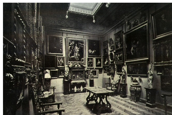
Muzeul Kalinderu și sală din muzeu