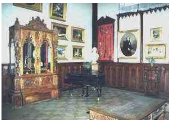
Interior din Muzeul Aman