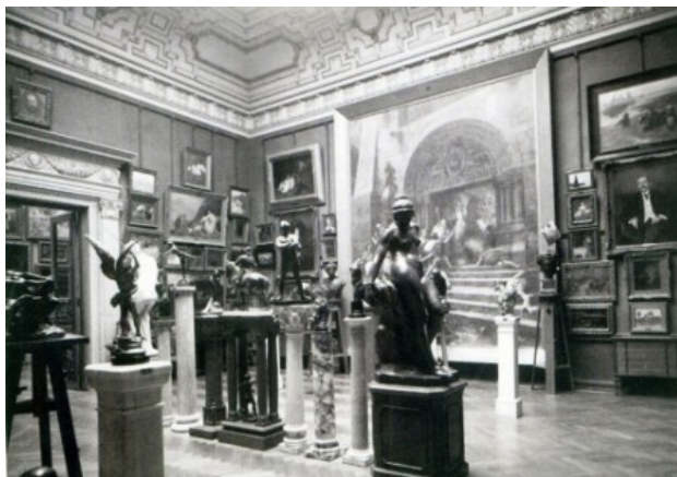
Sală din Muzeul Simu